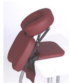
Photo : desktop